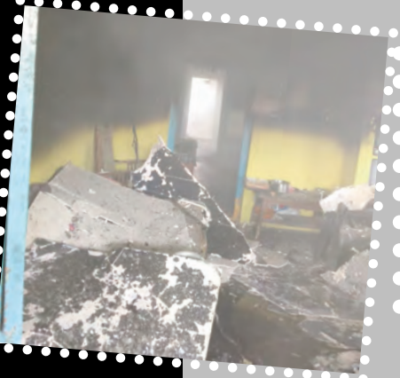
- మందమర్రి, మే 24, ప్రభాతవార్త